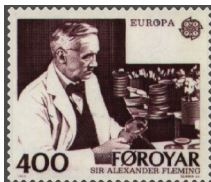
Figur: Skotten Alexander Fleming